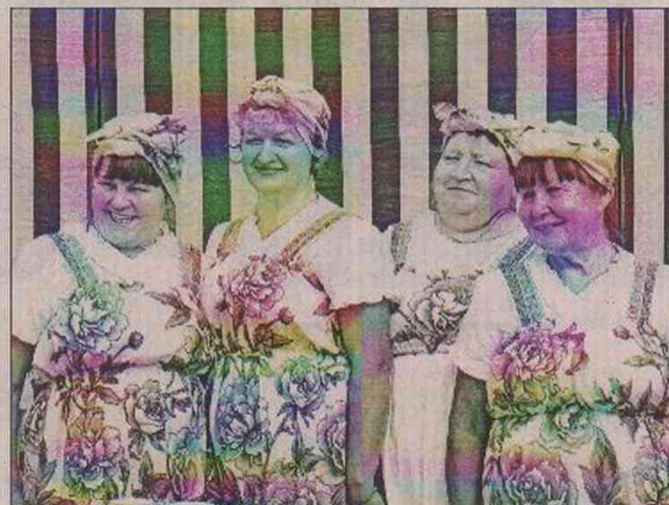
Самое дальнее и самое веселое МО - это «Синицкое». Тут жизнь так и кипела даже на трех метрах «арендованной» земли!

Но это также относится ко всем участникам веселого, звонкого, радужного традиционного праздника в Сосенках. Было на что посмотреть, что купить, чем полюбоваться.