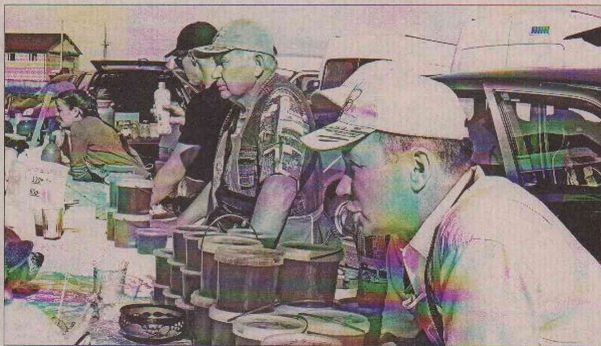
лова из д. Леонтьевская и десятков других.

А рядом зазывают и нахваливают свой мед пчеловоды из Тарноги, Верховажья, Вельска, Коноши.