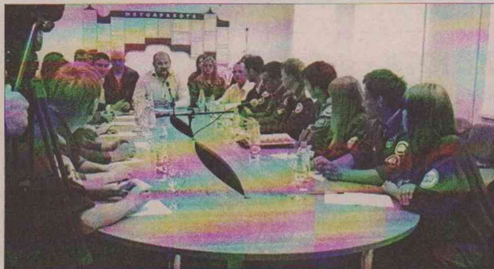
Рабочая поездка губернатора Архангельской области закончилась встречей с бойцами Всероссийской студенческой стройки «Поморье».