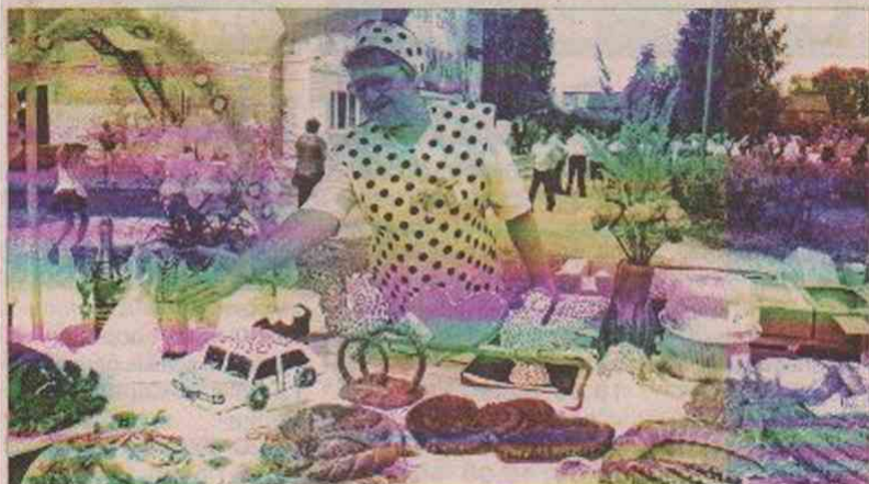
Выставка «Свадебный каравай» ООО «ПО «Устьяны»