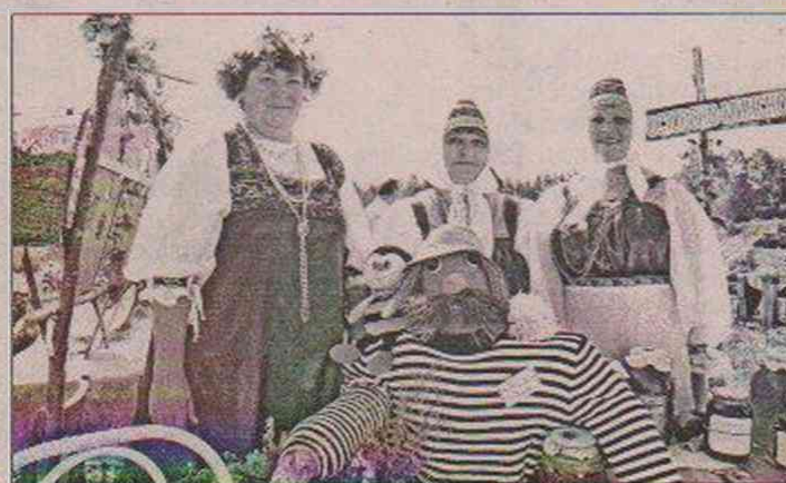
Дед-пчеловод за собой уведет