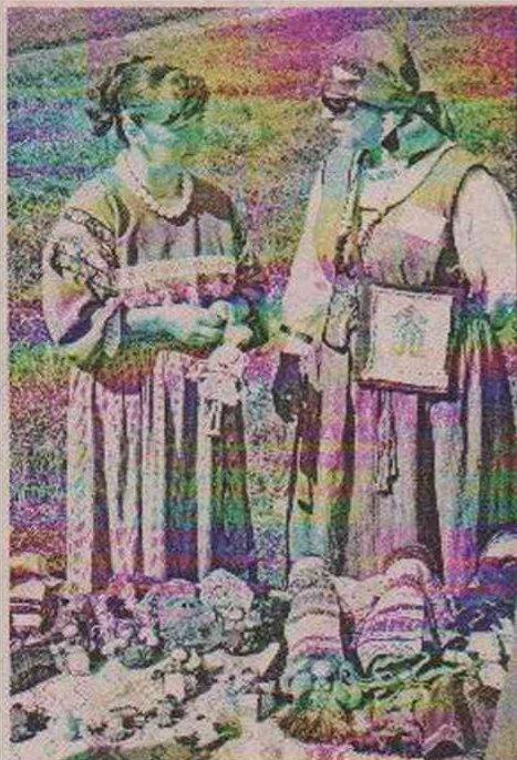
Наши мастерицы готовы опытом делиться