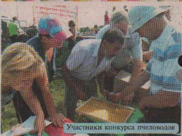
Участники конкурса пчеловодов