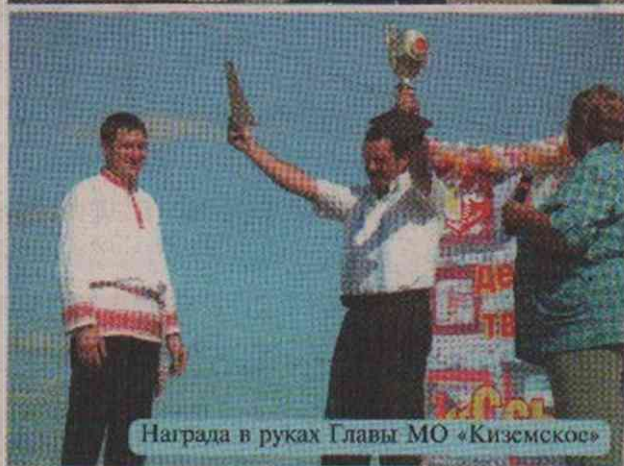
Награда в руках Главы МО «Киземское»