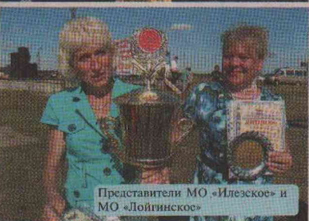
Представители МО «Илезское» и МО «Лойгинское»