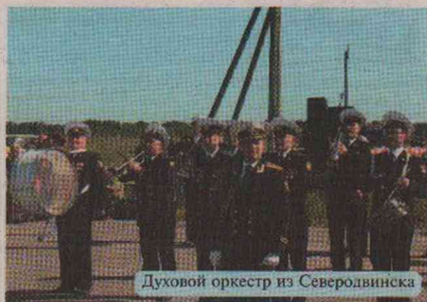
Духовый оркестр из Северодвинска